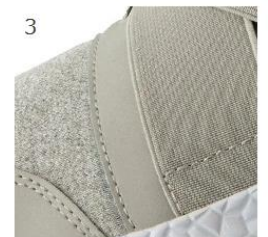
3 ゴムストラップの程よい締め付けでフィット感良好