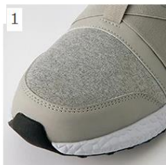
1 先芯は樹脂先芯を使用