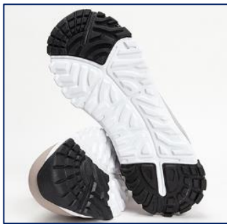
【ソール】003ライトグレー・025カーキ