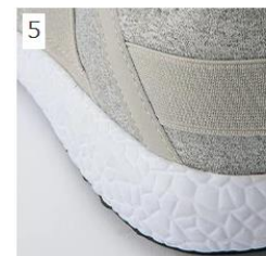
5 ミッドソールにはEVAを使用しクッション性抜群